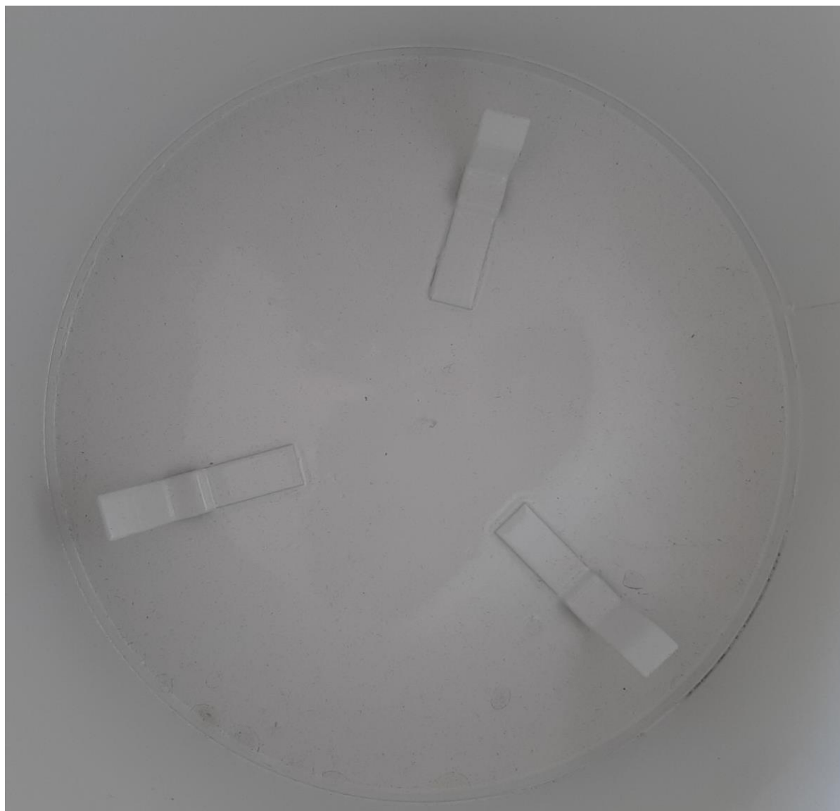
Rys 2. Dno podstawy deszczomierza Hellmanna. Widoczne trzy wąsy stabilizujące zbiornik wewnątrz podstawy.