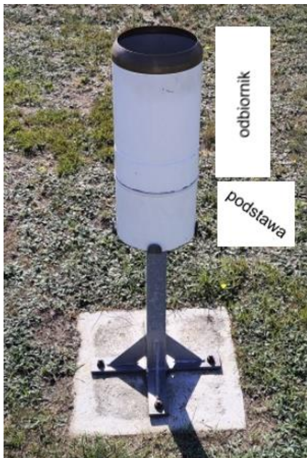
Rys. 1 a – Współczesny deszczomierz Hellmanna