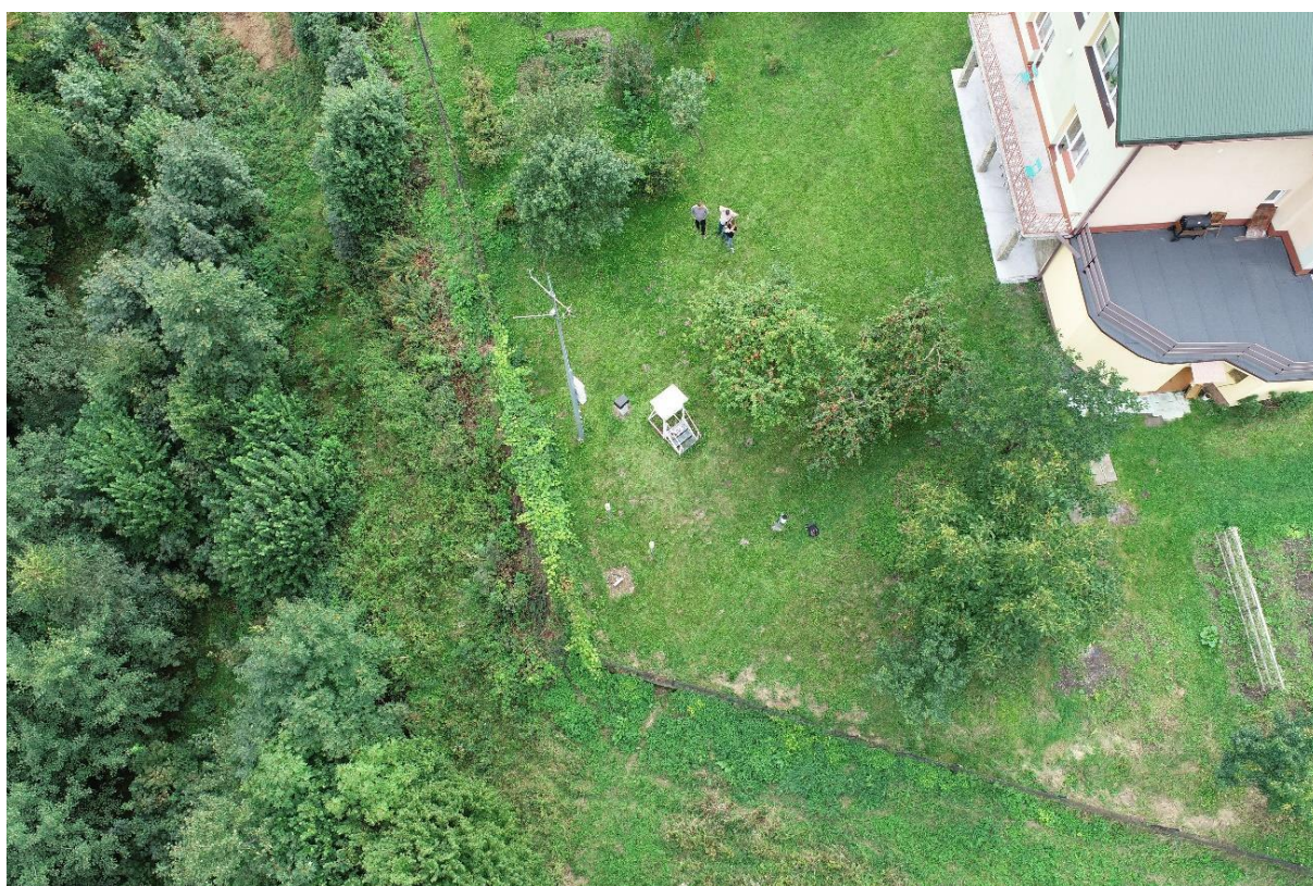
Zdjęcie 1 Widok z drona