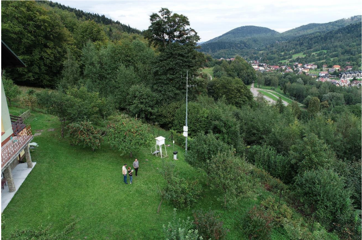
Zdjęcie 2 Widok z drona