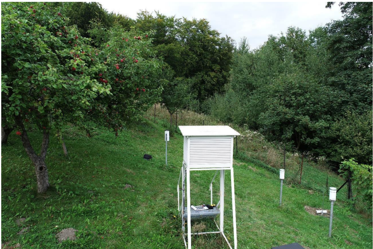
Zdjęcie 3 Widok z drona