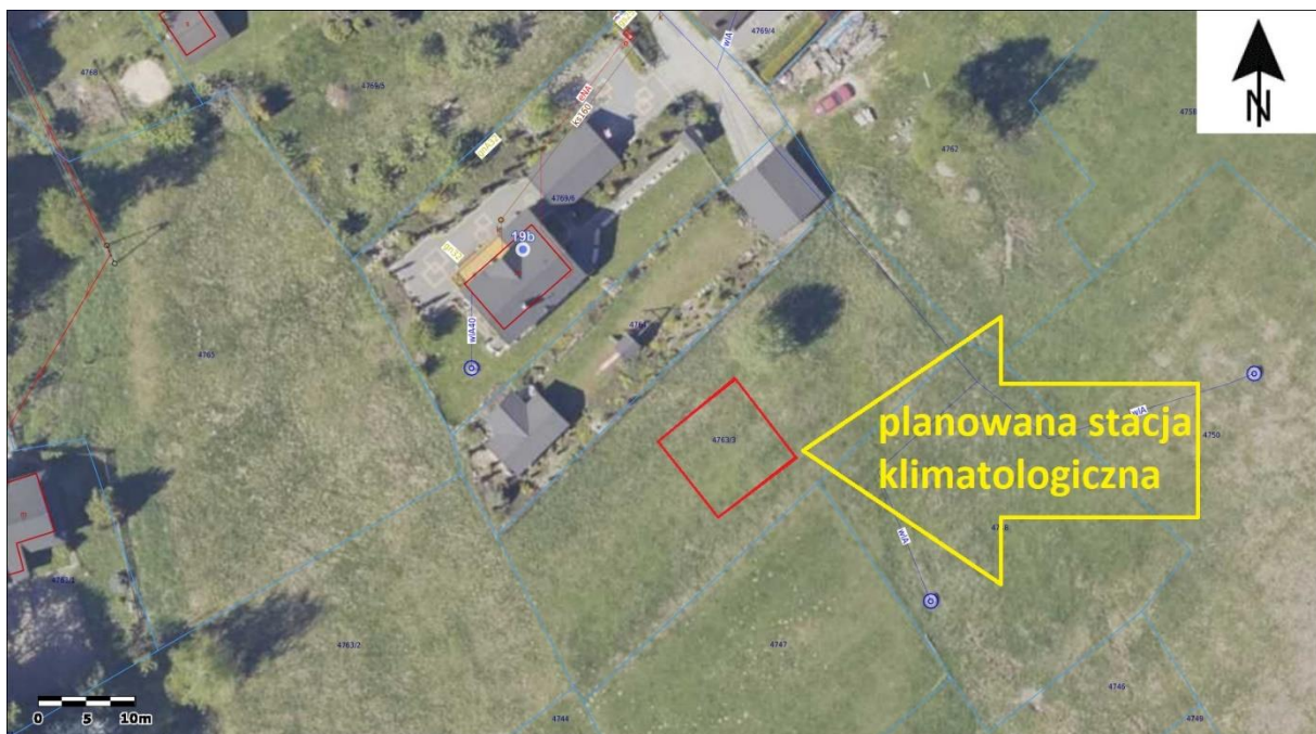
Mapa 2 Szkic nowej lokalizacji