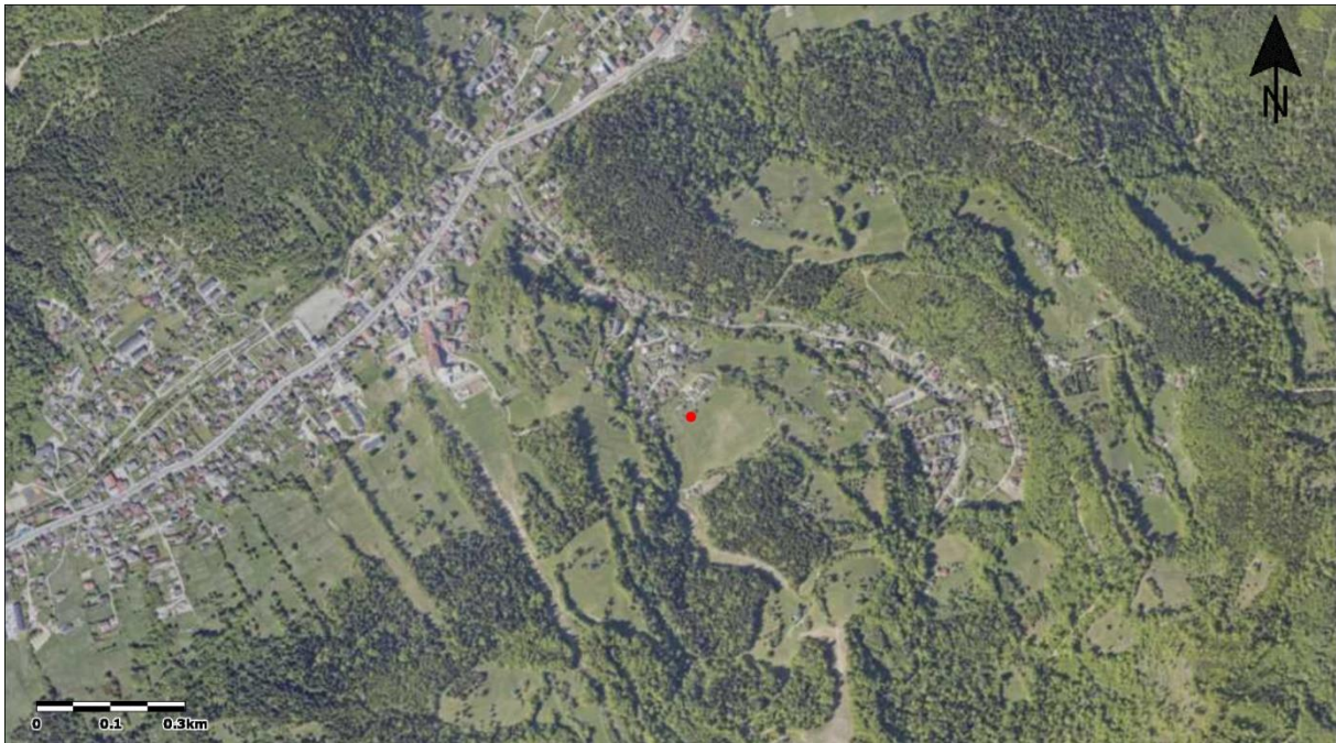
Mapa 1 Nowa lokalizacja