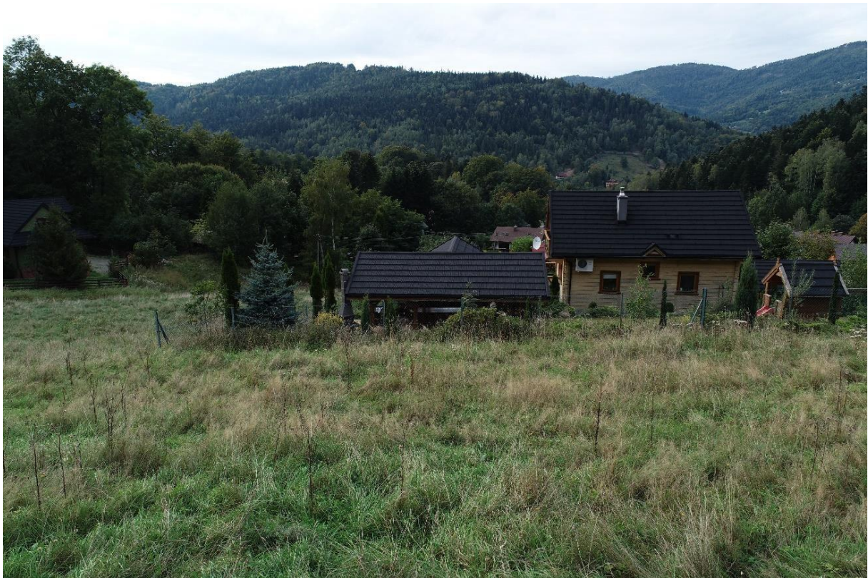
Zdjęcie 1 Nowa lokalizacja