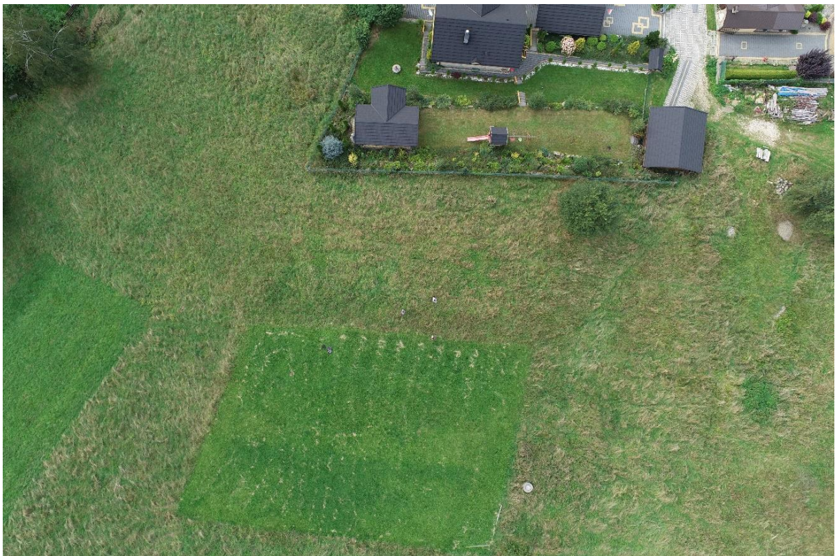
Zdjęcie 2 Nowa lokalizacja – widok z drona