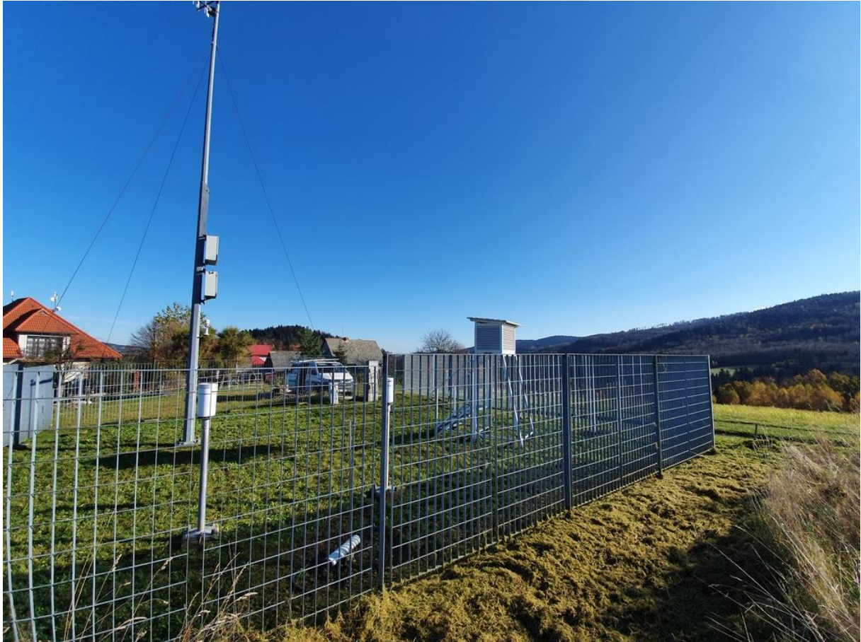
Zdjęcie 4 Stacja klimatologiczna - zdjęcie poglądowe