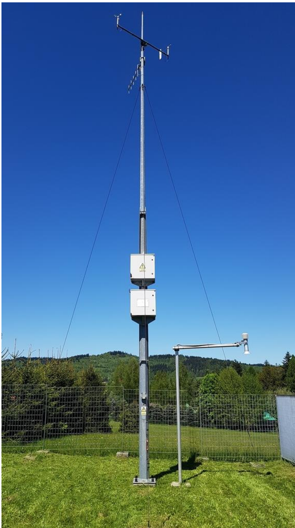
Zdjęcie 3 Maszt wiatromierza - zdjęcie poglądowe