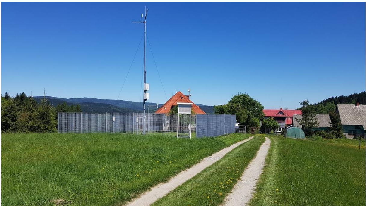
Zdjęcie 5 Stacja klimatologiczna - zdjęcie oglądowe