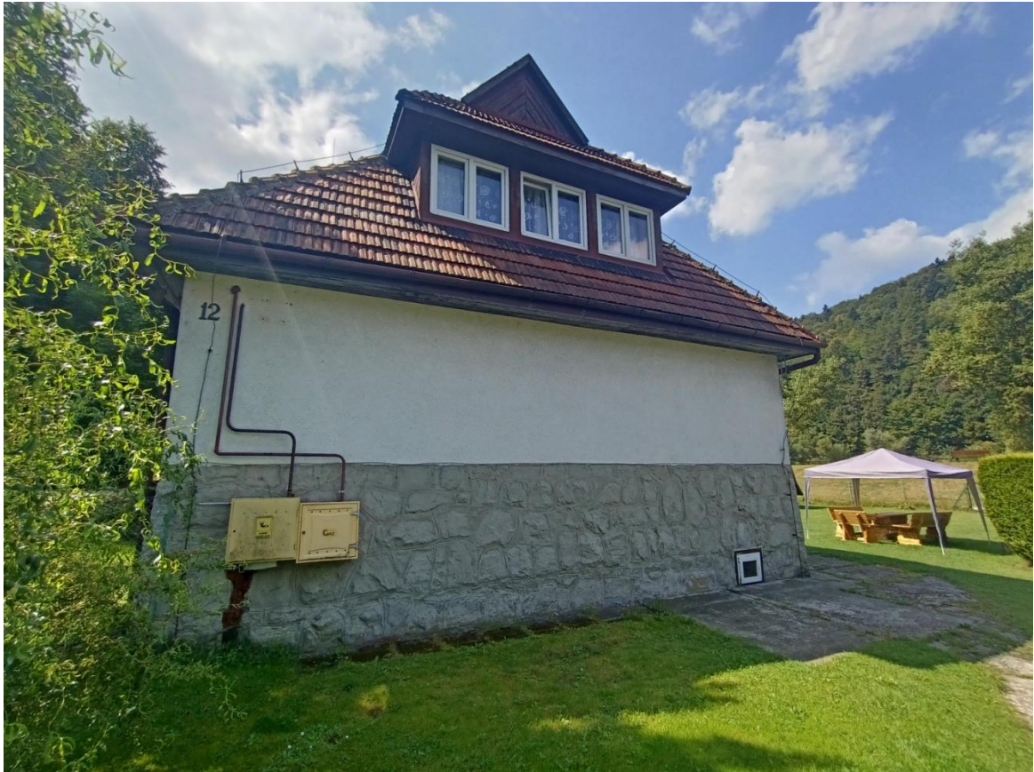
WEJŚCIE DO BUDYNKU