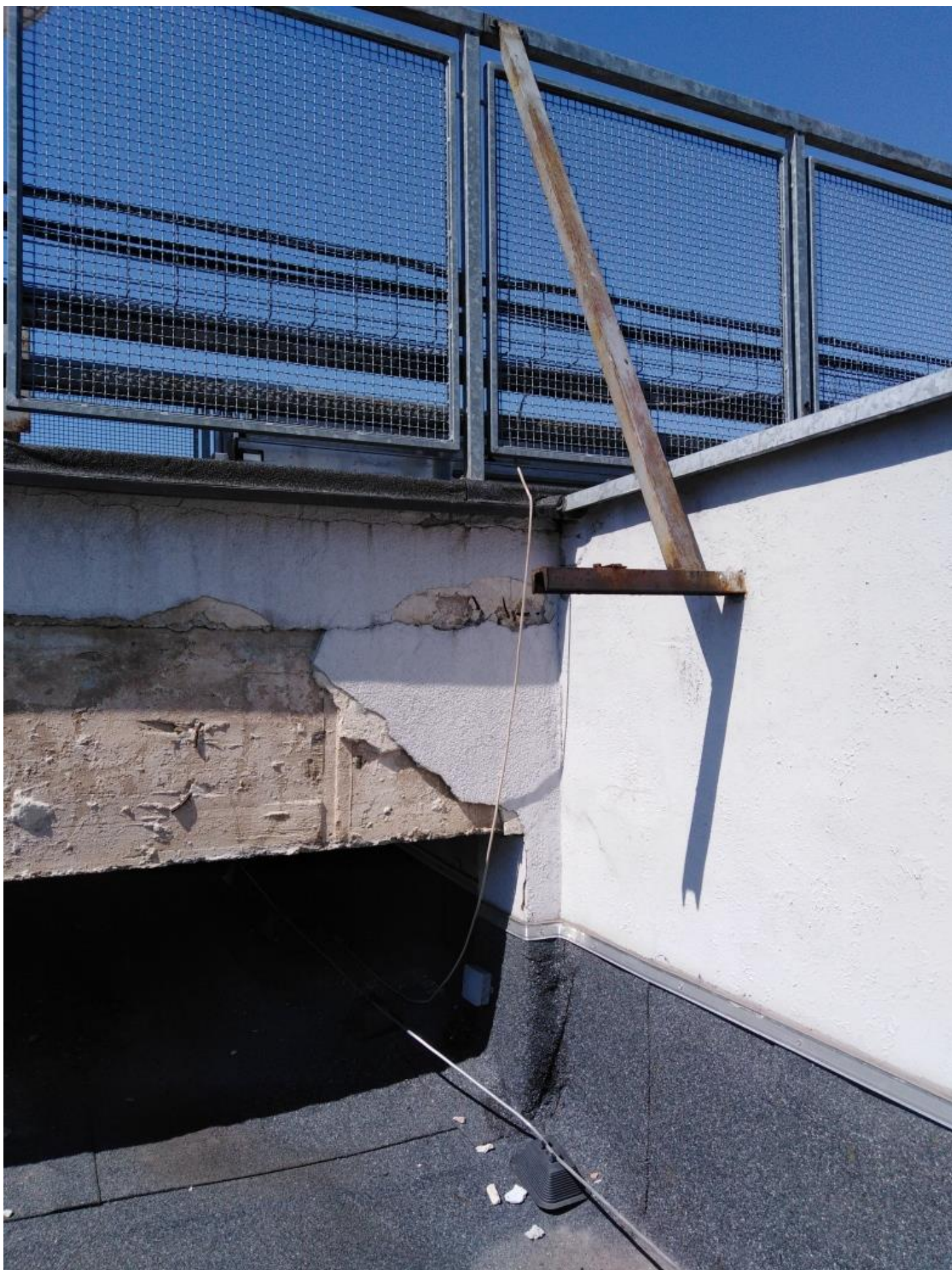
Przewiązka, część nad budynkiem E