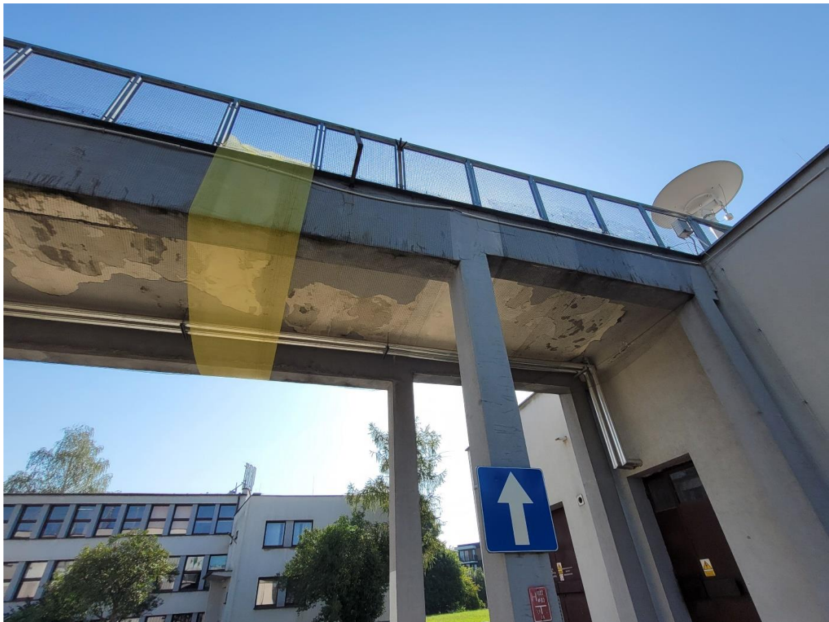
Widok od dołu, część południowa