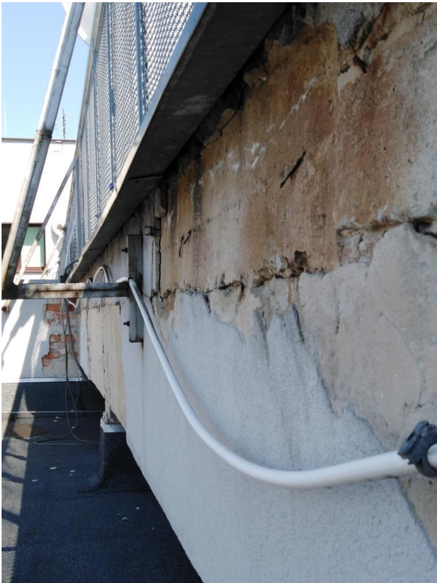
Przewiązka nad budynkiem „E”