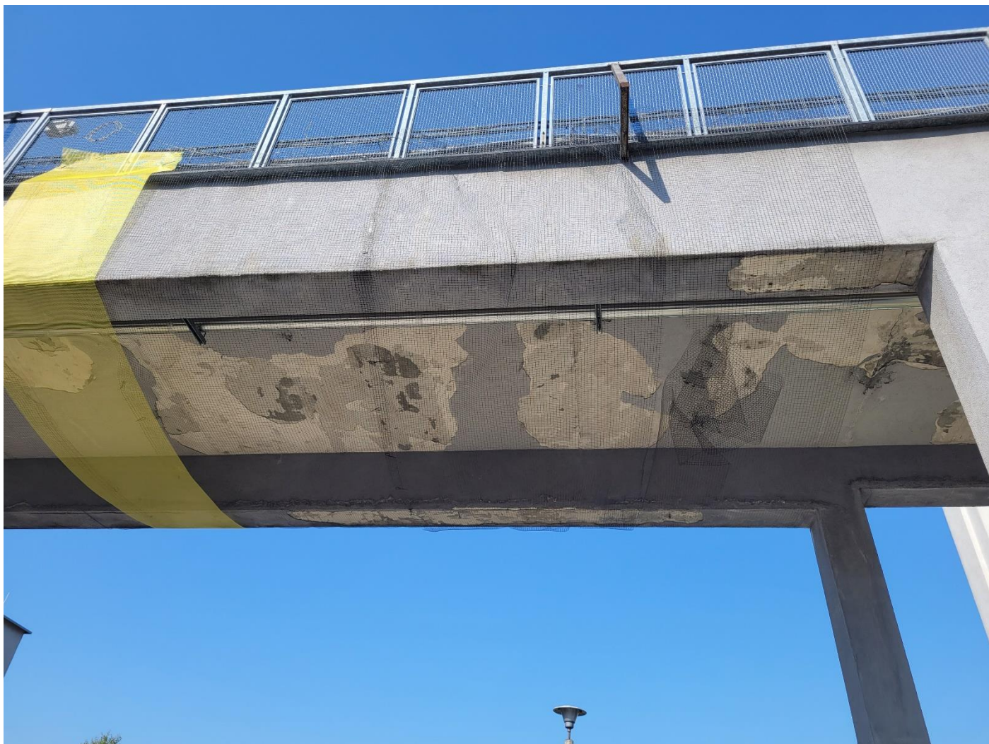
Widok od dołu, część południowa