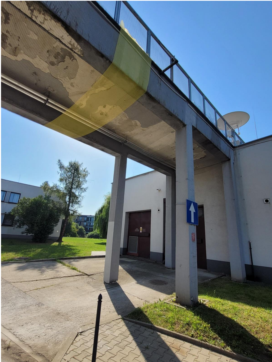
Widok od dołu, część południowa