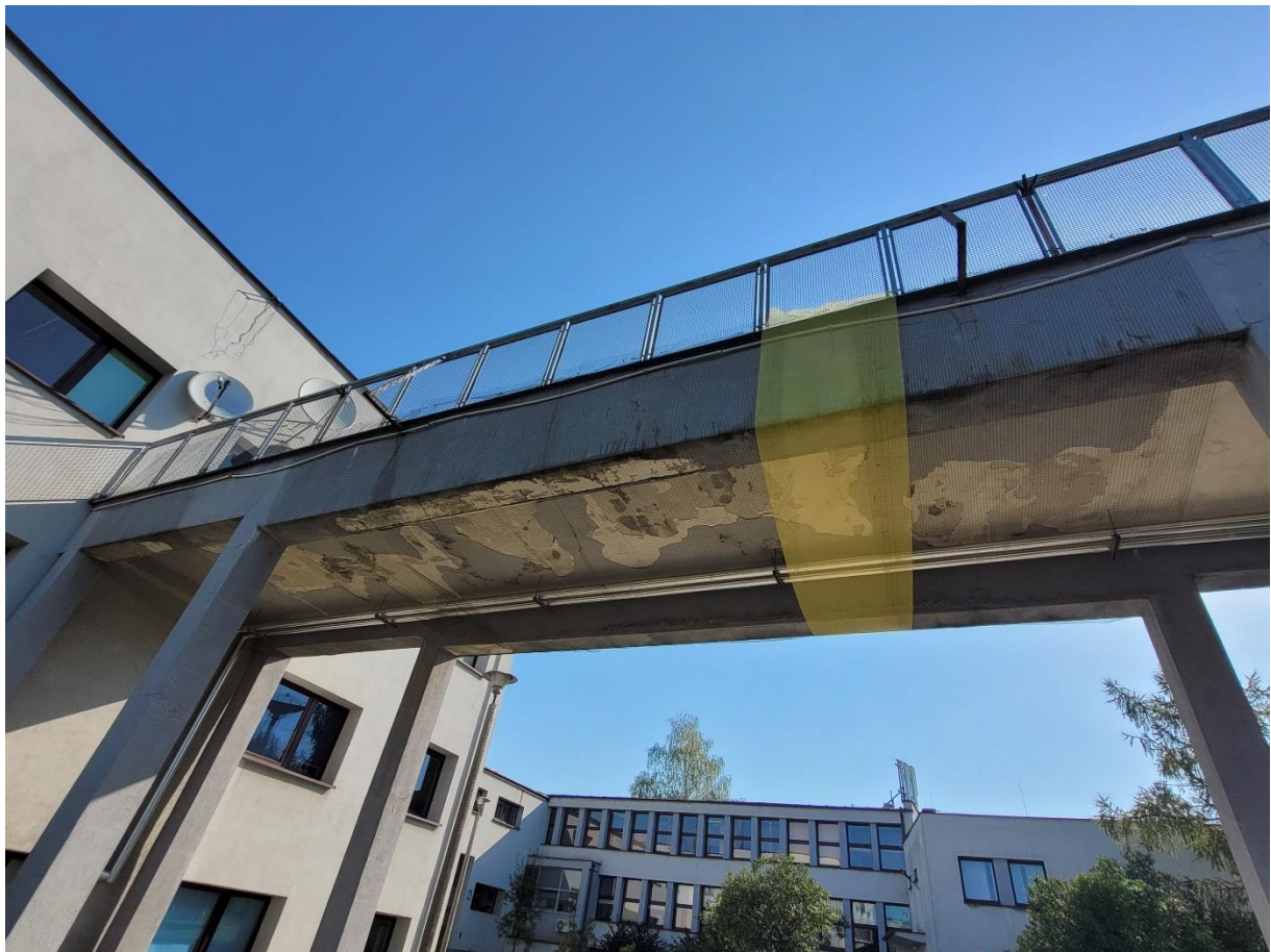
Widok od dołu, część północna