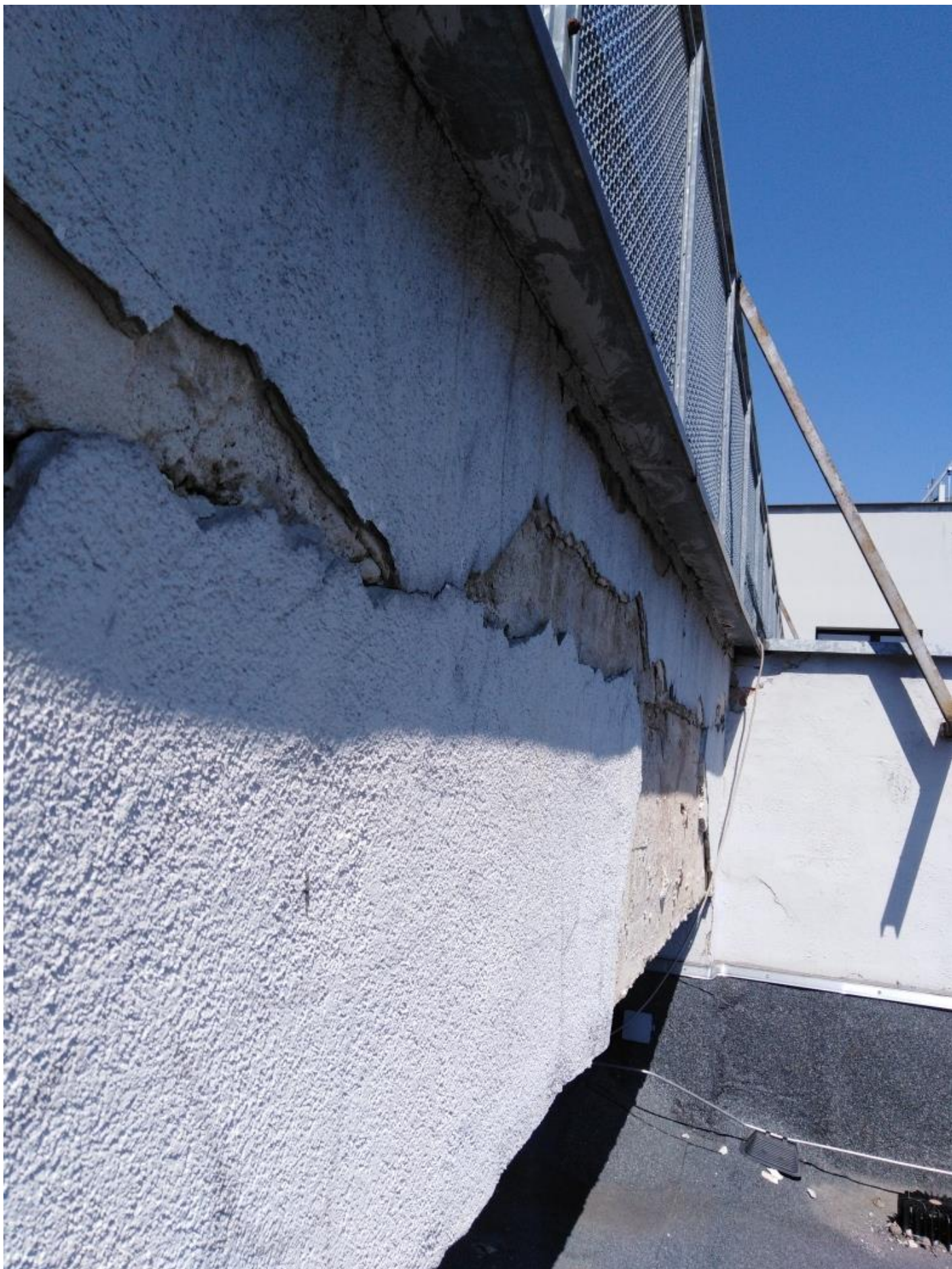
Przewiązka, część nad budynkiem E