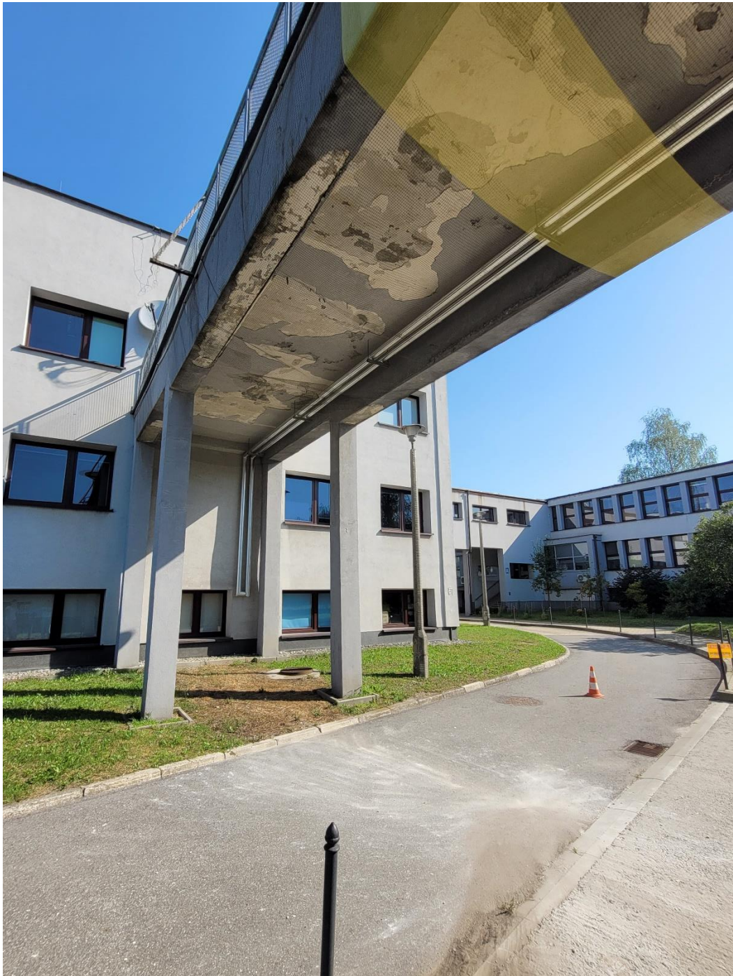
Widok od dołu, część północna