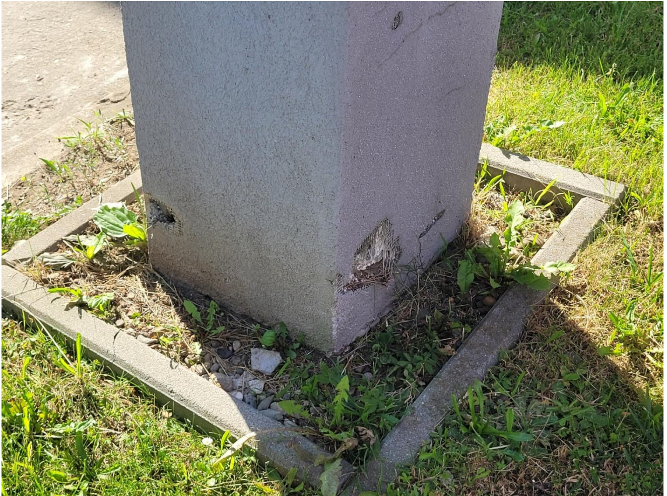
Słup, połączenie z gruntem