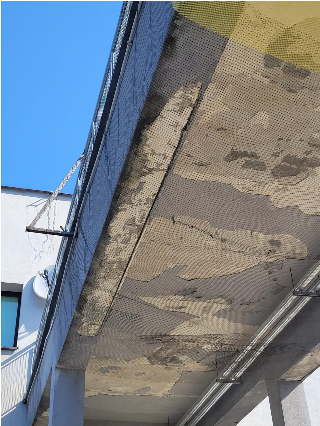
Widok od dołu, część północna