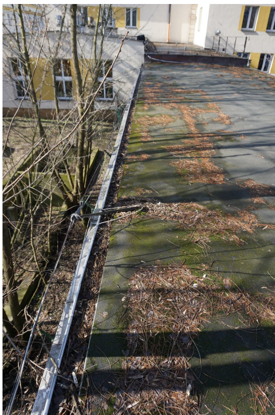
STAN TECHNICZNY RYNIEN I INSTALACJI ODGROMOWEJ